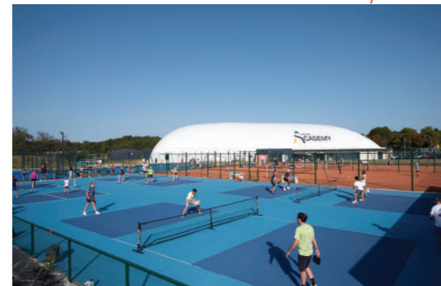
Terrains de Pickleball extérieurs