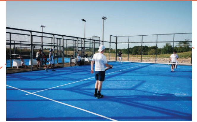
Pistes de Padel extérieures