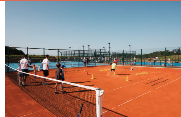
Courts de Tennis extérieurs tous temps