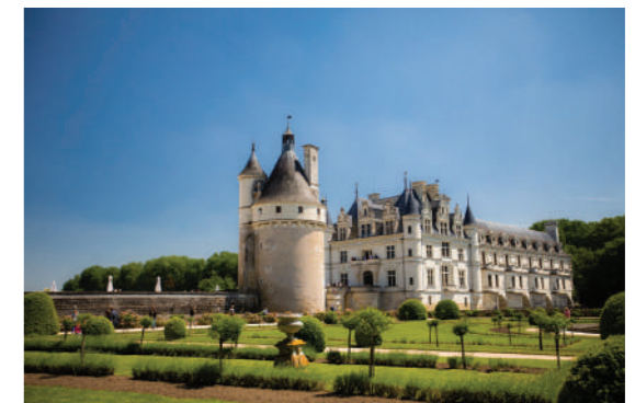
Au coeur de la Vallée de la Loire, découvrez en famille les trésors touristiques et culturels de Tours et ses environs.