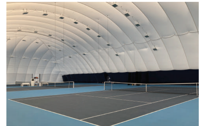
Courts de Tennis résine sous dôme